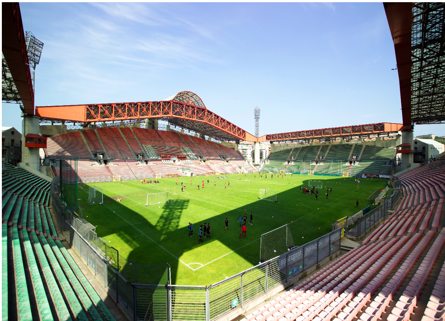
Lo Stadio Nereo Rocco

studenti delle scuole locali) con conseguente visibilità televisiva e il ricavato dell'ingresso allo stadio (2 o 3 euro) saranno devoluti all'Ospedale Pediatrico Burlo Garofalo (ovviamente gli atleti non dovranno pagare tale ingresso). Verrà dunque svolto un allenamento congiunto davanti ad una platea gremita per far conoscere il Taekwondo.